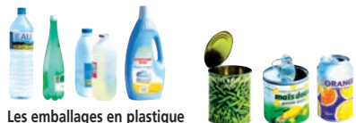
Les emballages en plastique (bouteilles, flacons...)